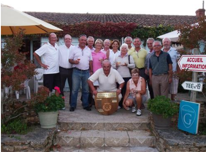
Le trophée est désormais accroché dans le club house !..